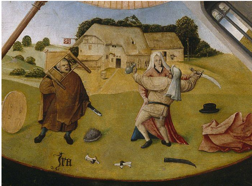
Hieronymos Bosch: a hét főbűn képének bosszú részlete

Ugyanakkor sokszor tényleg elárulnak, megsértenek, bántanak, megaláznak vagy manipulálnak, és nem csak életellenes dolgokat követhetnek el ellenünk, de egyszerűen csak nem adják meg azt a tiszteletet ami jár nekünk. Kétségtelen ilyenkor az önértékelésünk határozza meg a harag létrejöttét – mert aki teljesen lebecsüli önmagát az nem is igényli a tiszteletet -, de ha nem éreznénk haragot, akkor nem is kapna a másik ember visszajelzést arról, hogy mik az igényeink, és aztán már önhibáján kívül is lebecsülhet, bánthat stb. minket. Vagyis ezek az érzelmek erős szabályozók minden társas lény esetében, noha természetesen az érett személyiség ura a haragjának és másképp is tud „énközlést” küldeni 19 . Viszont épp most hívhatjuk fel a figyelmet a divatos kommunikációelméletek kritikájaként arra, hogyha teljesen indulatnélkülivé válnánk – mint ahogy ezek a tanácsok javasolják – akkor elveszítenénk emberi szerethetőségünk, gépiesnek vagy modorosnak tünnénk.